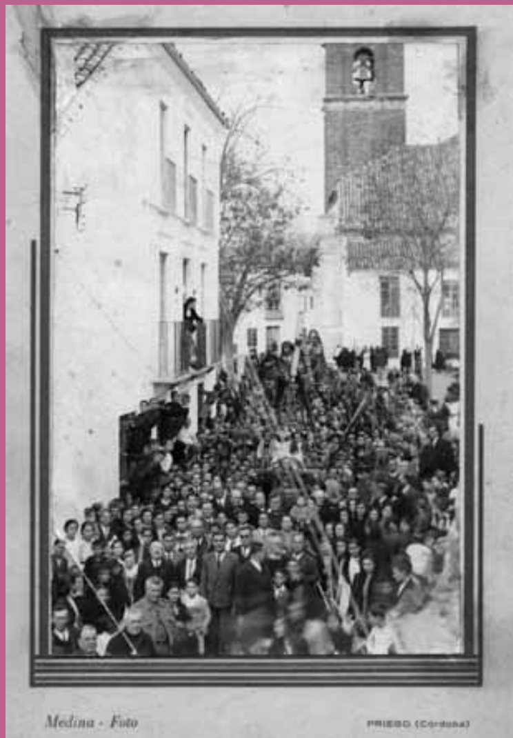
Medina - Foto