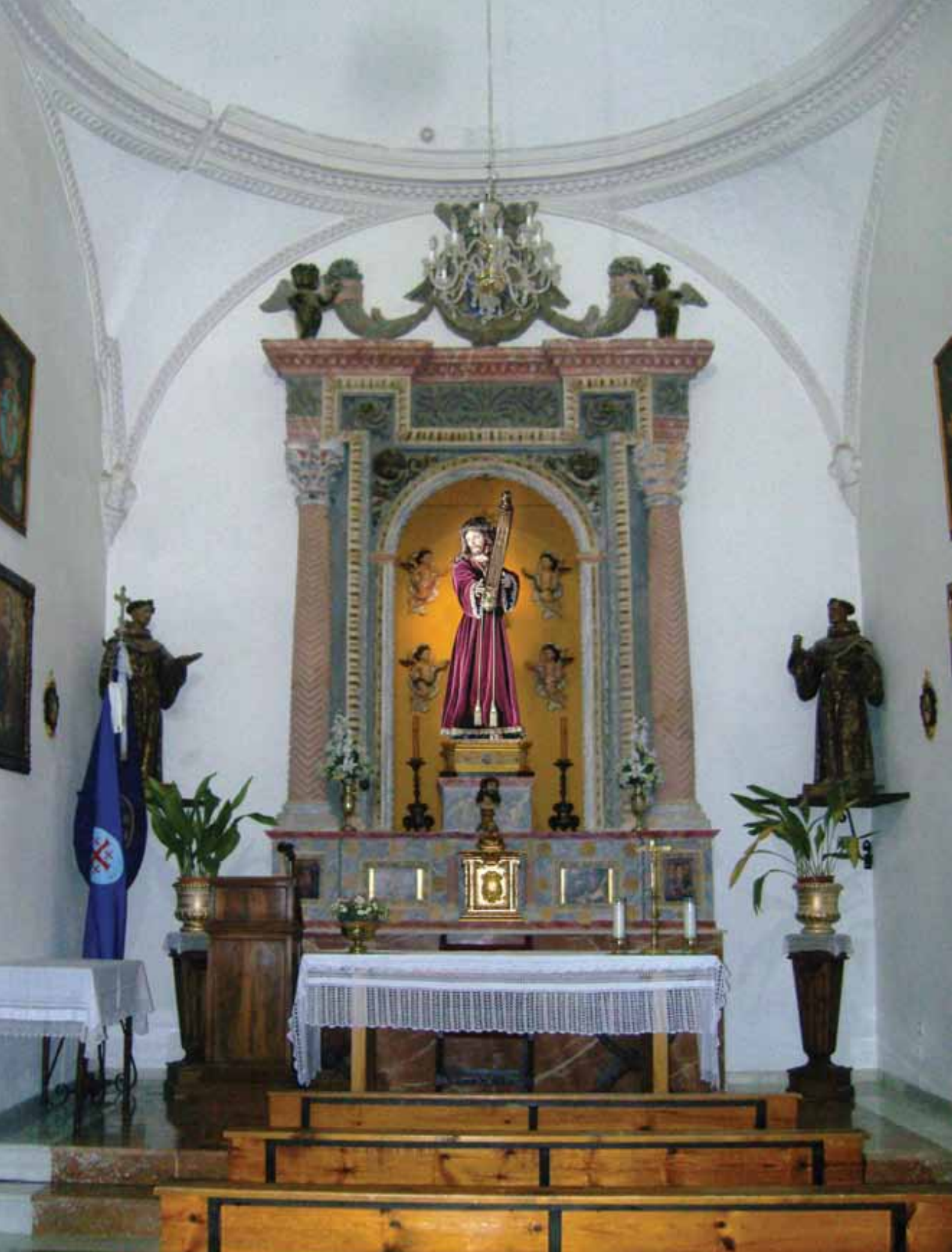
Antigua capilla de Jesús Nazareno. Representación figurada