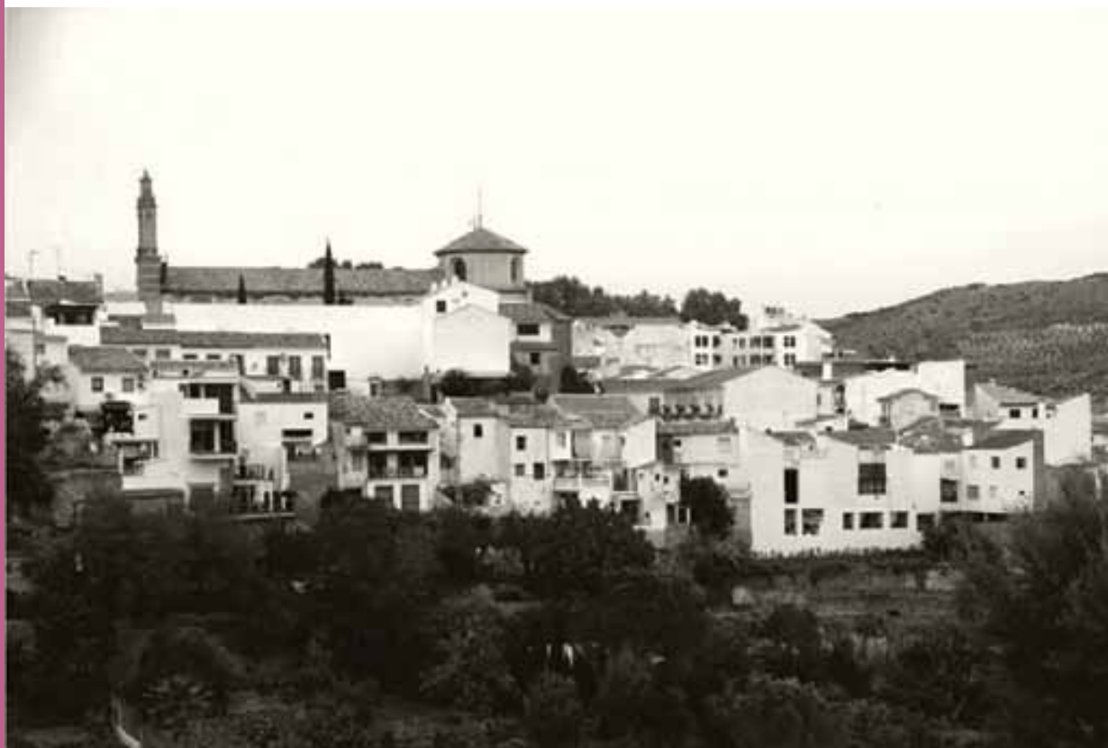
Vista de la iglesia y convento de San Francisco desde La Hoya

CENA DE CLAUSURA OFRECIDA POR LA HERMANDAD DE JESÚS NAZARENO RESTAURANTE CALIFATO