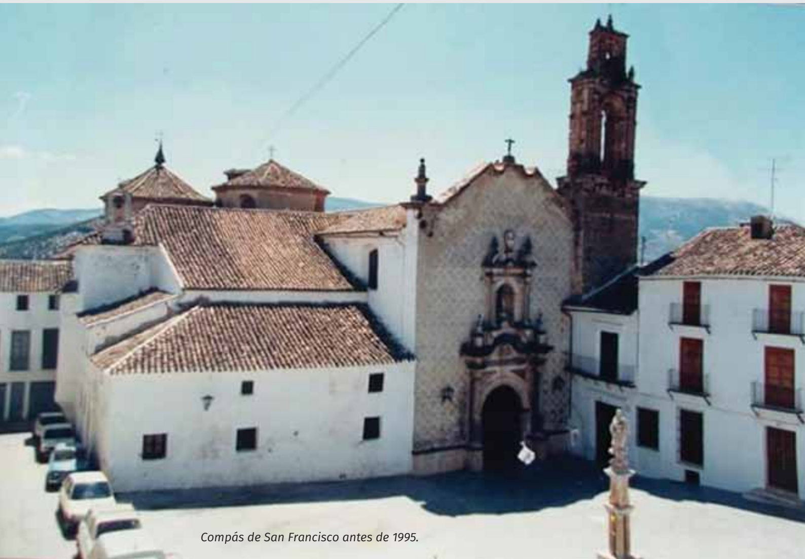
Compás de San Francisco antes de 1995.

Abrigamos la esperanza de que nuestro Congreso cubra sus objetivos y constituya un referente para quienes opten por continuar haciendo “camino nazareno”.